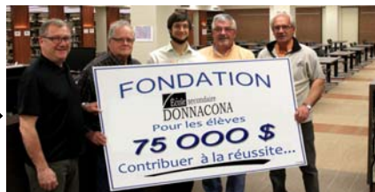
En 2013, la Fondation a remis son 75 000 ième dollar.